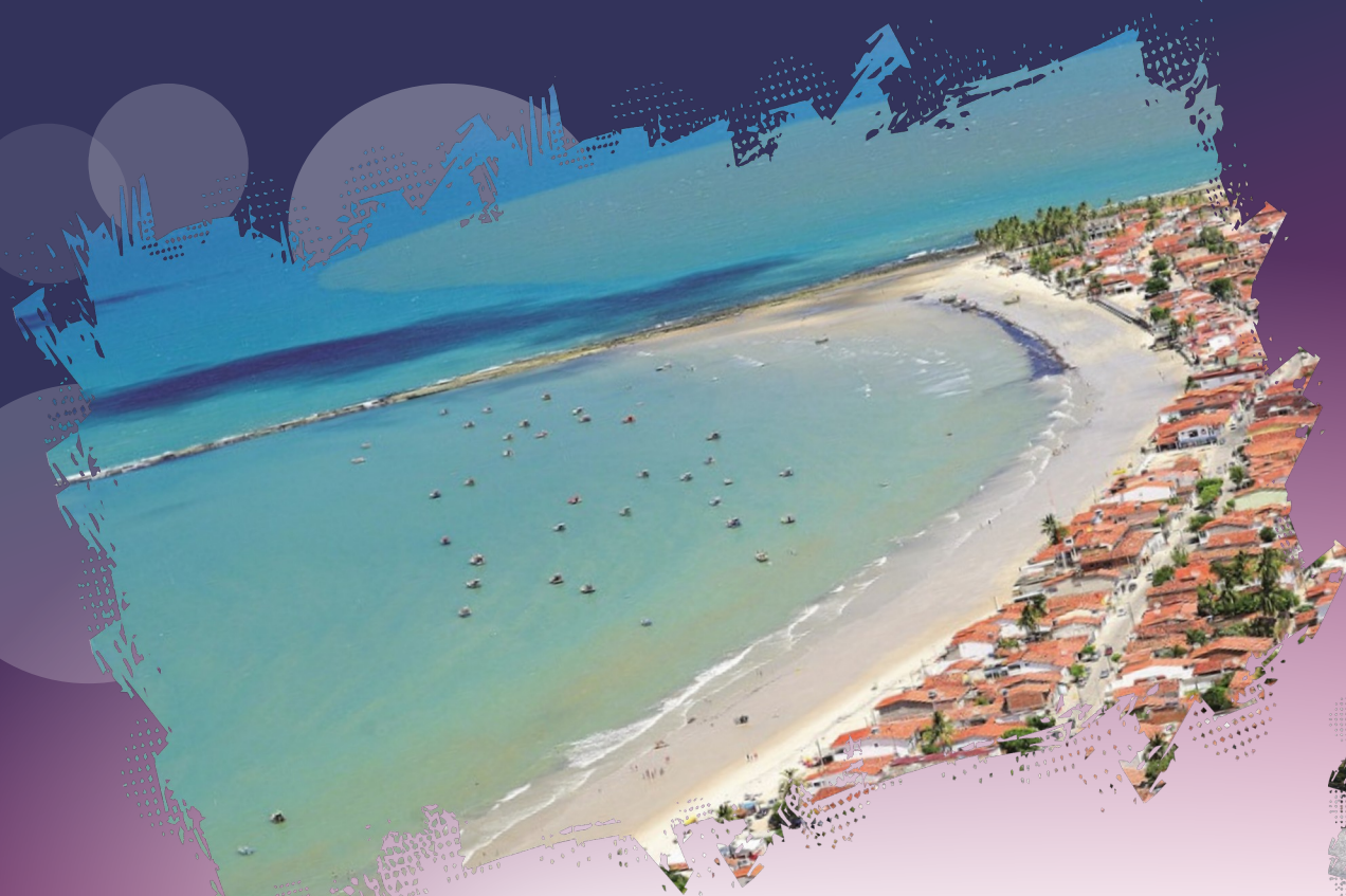
Praia de Pontinha