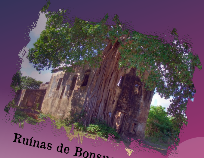
Ruínas de Bonsucesso