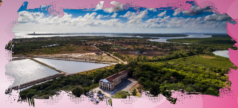
Igreja da Guia