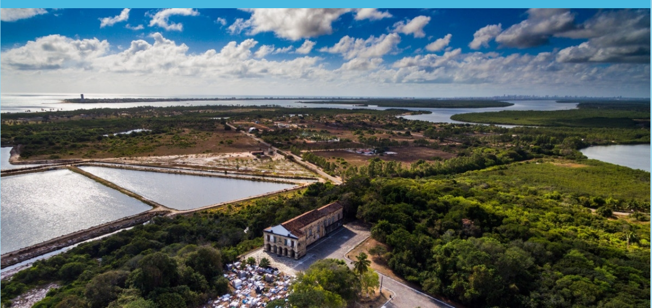
Igreja da Guia

A história da cidade começa com a chegada dos portugueses, os quais, por volta de 1596, passavam em Lucena em direção à Baía da Traição. Nessa época, eles ainda tinham receio de ocupar grandes faixas das terras paraibanas, construir residências e arriscar-se na administração de uma propriedade, muito disso em virtude das tribos locais, ainda em estado silvícola. Entretanto, o Governo da então Capitania da Paraíba, liderado pelo capitão-mor Feliciano Coelho de Carvalho, concedeu nessa época sesmarias na bacia do Rio Miriri aos frades beneditinos. A partir dessa ação tudo começou.