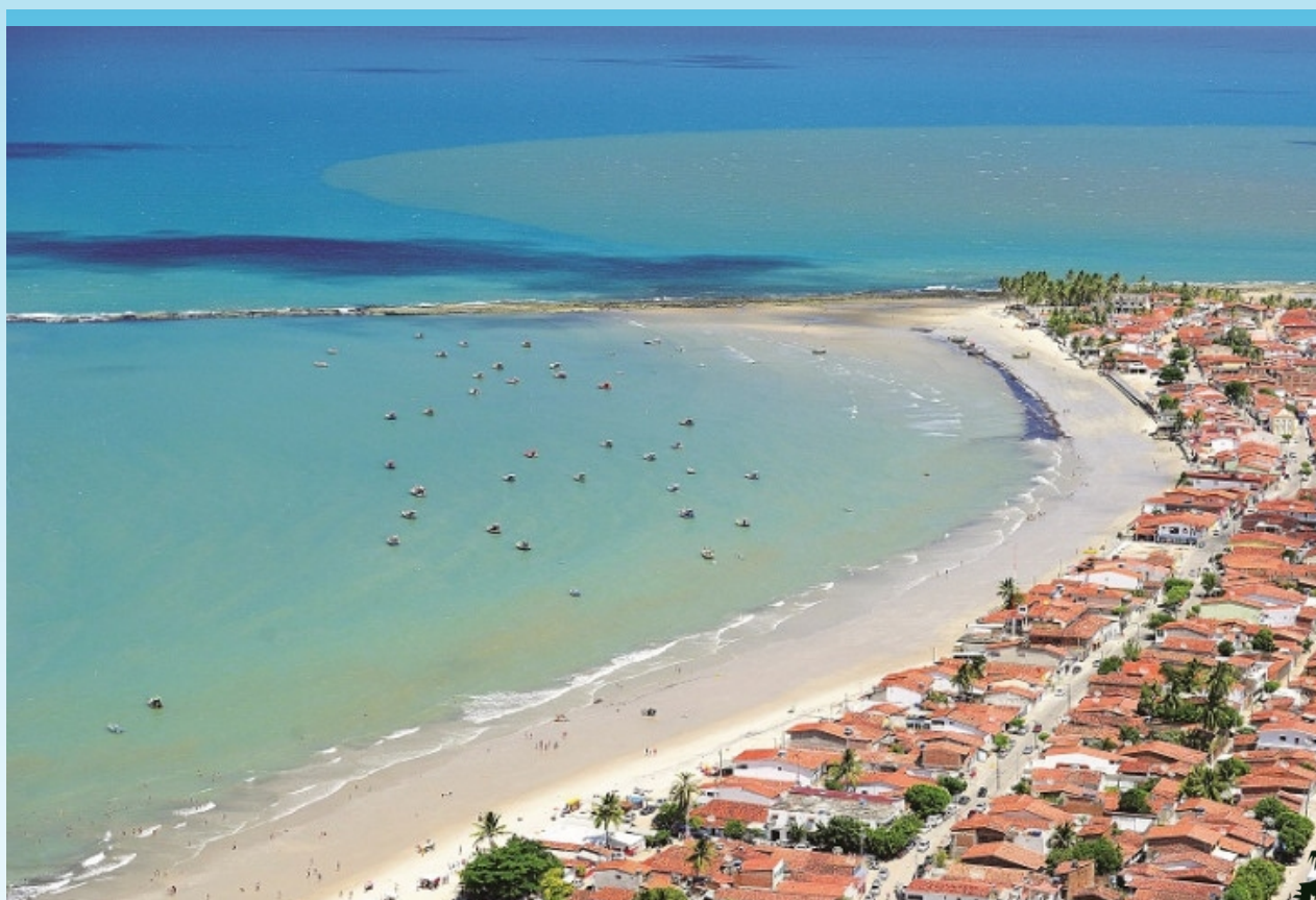
Figura 1: Foto de arquivo - Jornal da Paraíba

A Confederação Brasileira de Orientação - CBO e a Federação de Orientação da Paraíba - FOP, têm a honra de convidar toda a “família orientista”, nacional e internacional, para participar da X Copa Nordeste de Orientação e os 5 Dias de Orientação da Paraíba, que será realizada no período de 01 a 05 de dezembro de 2021, com áreas de competição localizadas em áreas rurais e urbanas do município de Lucena - PB.