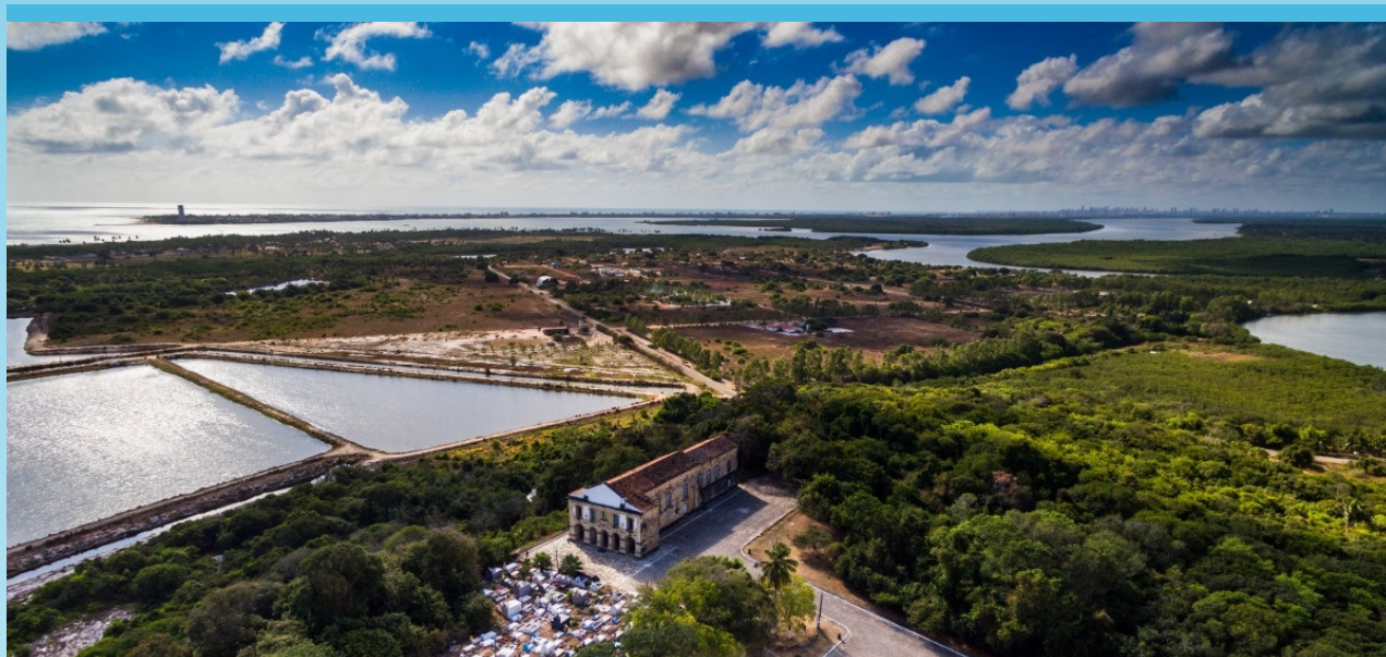
Igreja da Guia

A história da cidade começa com a chegada dos portugueses, os quais, por volta de 1596, passavam em Lucena em direção à Baía da Traição. Nessa época, eles ainda tinham receio de ocupar grandes faixas das terras paraibanas, construir residências e arriscar-se na administração de uma propriedade, muito disso em virtude das tribos locais, ainda em estado silvícola. Entretanto, o Governo da então Capitania da Paraíba, liderado pelo capitão-mor Feliciano Coelho de Carvalho, concedeu nessa época sesmarias na bacia do Rio Miriri aos frades beneditinos. A partir dessa ação tudo começou.