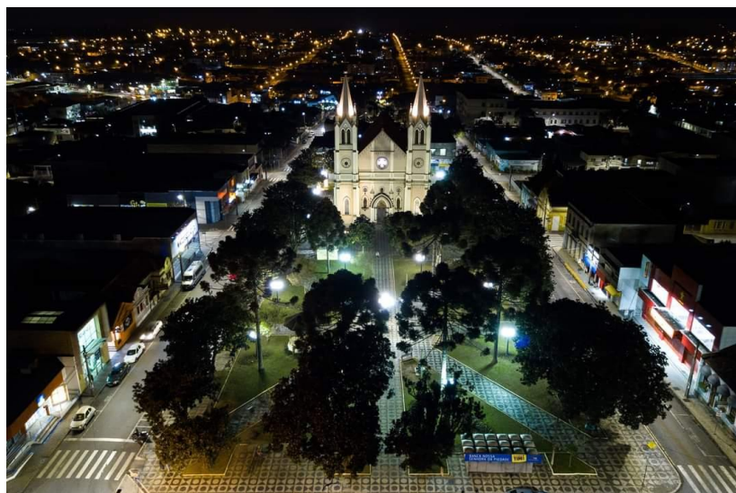
Campo Largo - PR

Clube de orientação gralha azul Fundado em 19 de abril de 2006 CNPJ: 08.908.190 / 0001-51 - www.coga.esp.br